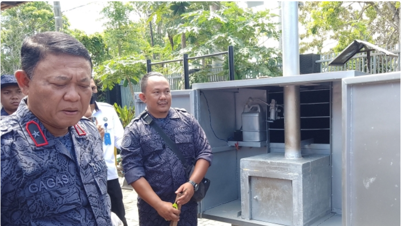
Kepala BNNP NTB saat pemusnahan BB sabu dengan mesin insenerator. (10/11)

Mataram NTB - Menindak lanjuti peraturan perundang-undangan terkait pemusnahan barang bukti narkotika yang disita dari hasil penindakan atas Peredaran gelap Narkotika, Badan Narkotika Nasional Provinsi Nusa Tenggara Barat (BNNP NTB) melakukan pemusnahan Barang Bukti hasil pengungkapan tindak Pidana Narkotika, Kamis (10/11).